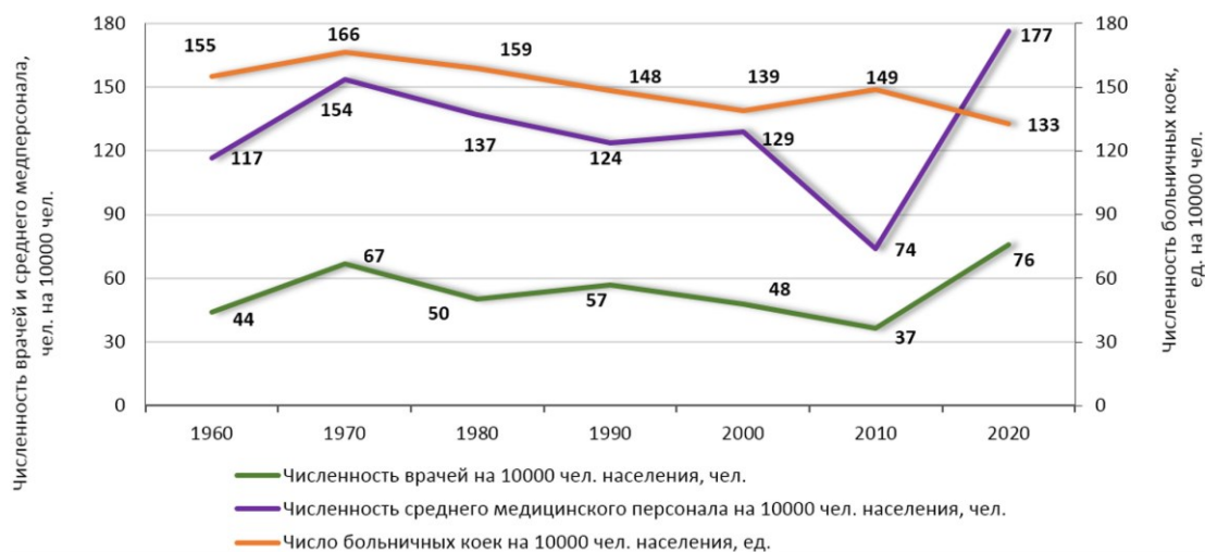
Рис. 3. Динамика показателей сферы здравоохранения г. Магадана.

В перестроечный период вследствие оттока специалистов показатели ухудшились (за исключением обеспеченности средним медицинским персоналом), однако с 2010 г. наблюдается положительная динамика в части обеспеченности населения врачами и средним медицинским персоналом за счёт реализации государственных целевых программ последнего десятилетия по привлечению в дальневосточные регионы специалистов здравоохранения и образования. К 2020 г. превышены уровни показателей 1990 г. по обеспеченности врачами на 33 %, средним медицинским персоналом на 42 %, на 11 % ниже обеспеченность больничными койками в расчёте на 10 тыс. населения (рис. 3). В 2020 г. в городе Магадане на 10 тыс. населения число больничных коек, численность врачей и среднего медицинского персонала в 2 раза превышали среднероссийские значения 10 .