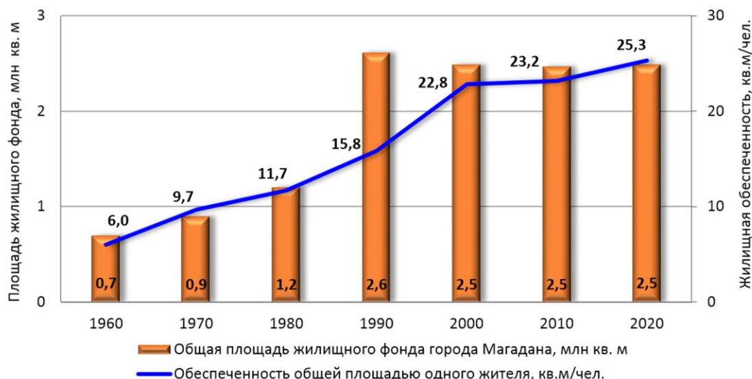
Рис. 2. Динамика общей площади жилищного фонда г. Магадана и обеспеченности на душу населения.

В период плановой экономики с 1960 по 1990 гг. город активно строился, сооружались промышленные и социальные объекты. В этот период жилищный фонд г. Магадана увеличился почти в 4 раза (рис. 2), при этом его доля в общеобластном объёме поднялась незначительно с 40 до 45 %, что обусловлено активным строительством жилья на всей территории региона 8 ; обеспеченность общей жилой площадью на 1 городского жителя возросла в 2,6 раза. На протяжении последних 30 лет новое жилищное строительство практически не велось, а в связи с закрытием и расселением ряда населённых пунктов доля городского жилищного фонда в общерегиональном объёме увеличилась до 61 % к 2020 г. На фоне уменьшения общей площади жилищного фонда за счёт выбытия ветхого и аварийного жилья обеспеченность жильём на душу населения растёт в результате уменьшения его численности (рис. 2).